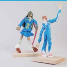
河野 未来 「学園」右⇒先輩、左⇒後輩