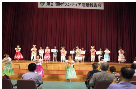
KSC アロハ・ハワイアンズの実演