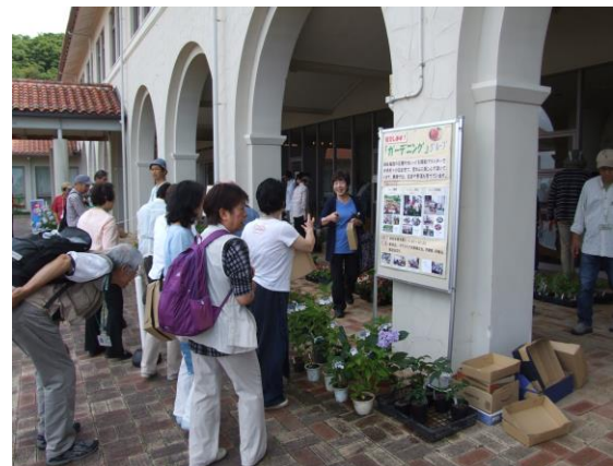
ガーデニンググループ