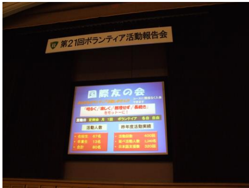
国際友の会の活動紹介