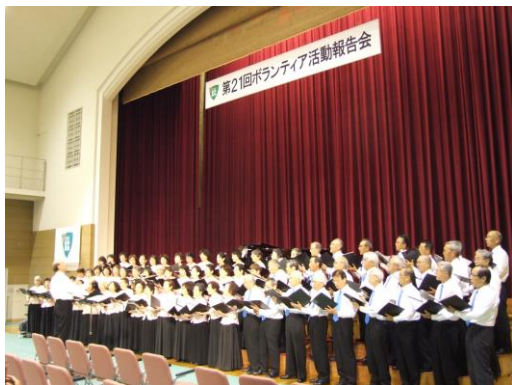
混声合唱団の実演