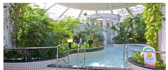
ジャングル温泉しあわせの湯

日時 5月5日（金曜・祝日）20日（土曜）21日（日曜） 10時から22時（最終受付21時） 場所 温泉健康センタージャングル温泉しあわせの湯 入浴料