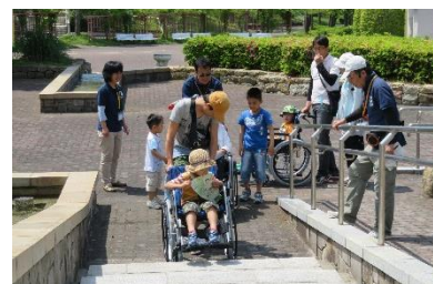
しあわせの村探検ツアー