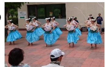
パフォーマンスの披露

日時 5月5日（金曜・祝日）11時から15時 場所 温泉健康センター オープンテラス 内容 市内で活動するチームのパフォーマンスを披露します 縁日（1回100円）もあります