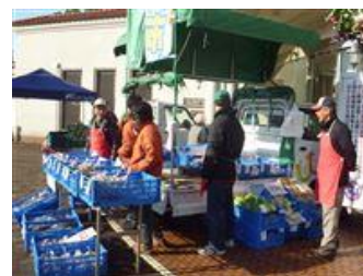
アゲインファームの野菜販売