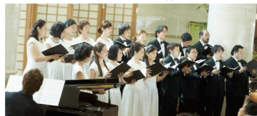
マンスリーミニコンサート