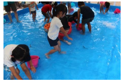
さかなのつかみどり

日時 7月21日(土曜)、22日(日曜) 8月4日(土曜)、5日(日曜) ①11時から ②11時30分から ③13時から ④13時30分から ⑤14時から ⑥14時30分から 場所 本館・宿泊館芝生広場側特設プール 対象 3歳以上(大人の参加も可) 定員 各時間20名 料金 1,000円 申込方法 電話(078-743-8040)又は温泉健康センター窓口 締切 開催日前日