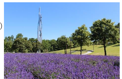
しあわせの村に咲くラベンダー