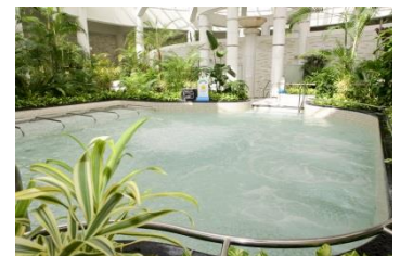
ジャングル温泉しあわせの湯

期間 7月21日(土)から8月31日(金) 場所 ジャングル温泉 しあわせの湯 対象 中学生以下