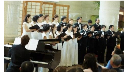
マンスリーミニコンサート

日時 7 月 1 日（日曜）13 時 30 分から 14 時 10 分 場所 本館・宿泊館エントランスホール 内容 神戸市混声合唱団による定期コンサート。 童謡からオペラまで、幅広い音楽をお届けします。 テーマ 「そうだ！海へ行こう！！」