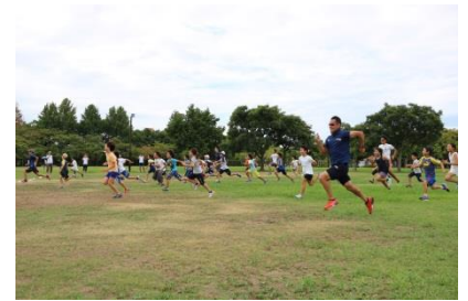
キッズ走り方教室

※なかよしクラスは障害者手帳をお持ちの小学生以上で、 自立歩行が可能な方や発達の気になる方が対象