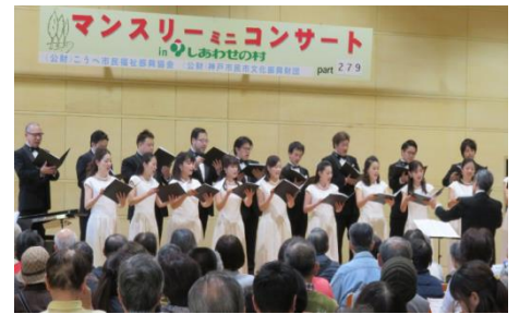
マンスリーミニコンサート