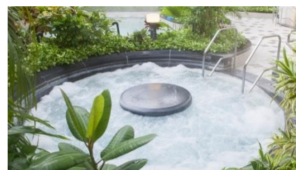
ジャングル温泉しあわせの湯