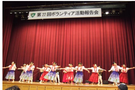
KSC アロハ・ハワイアンズの実演