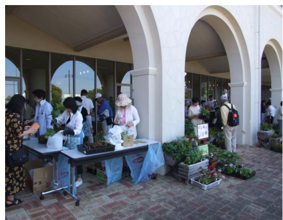
ガーデニンググループ