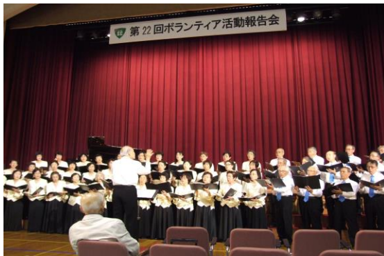
混声合唱団の実演