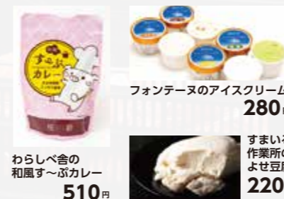
わらしべ舎の和風す〜ぶカレー 510円

東日本大震災後の交流活動でつながりのできた仙台市の障がい者施設で作られた商品を販売しています。そして、今年の5月から新たに、こんにやくの販売を開始しました。