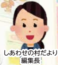
しあわせの村だより 編集長

毎年実施するアンケートでは、多くのお客様の声をいただき、より良い店舗づくりに励んでいます。