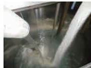
粉と水を攪拌している