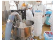
成型する前の状態