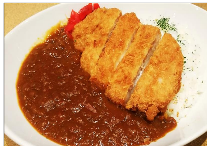
一番人気の カツ咲薫咖喱!!