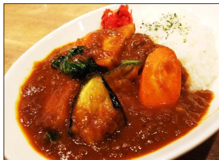
とれたて野菜がたっぷり 季節の野菜咲薫咖喱