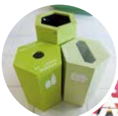
口の形と色でゴミを分別するゴミ箱

ユニバーサルデザイン(UD)とは、「最初から誰もが利用しやすいようなモノや仕組みなどを作ろうとする考え方」です。こうべUD大学はUDの普及を目的に、衣・食・住など身近なテーマから講師(キッズニア甲子園、神戸ポートピアホテルなど)を招いて学ぶ市民講座です。この公開講座は、こうべUD大学の受講生以外の方にも受講していただけます。