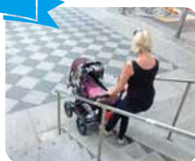
ベビーカーを押しながら階段を降りる母親