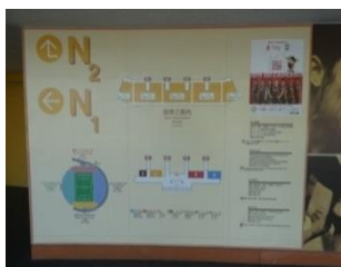
スタジアム内のサイン

スタジアム内にはたくさんの多言語による案内サインやピクトグラム、多機能トイレなど、多くの利用者にとって配慮された工夫があります。そうした工夫を学んだ後に自分なりに考えた“UDスタジアムマップ”を作成し、ユニバーサルデザインの気づきを深めます。※プログラムについては変更がある場合がございます。