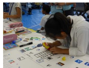
スタジアムマップづくり